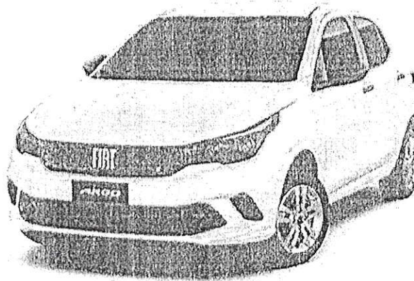
FIAT ARGO 1.0 FLEX 2021/2022

PREFEITURA MUNICIPAL DE CAPANEMA CNPJ: 75.972.760/0001-60